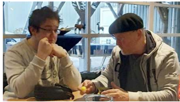
Ide en Henri