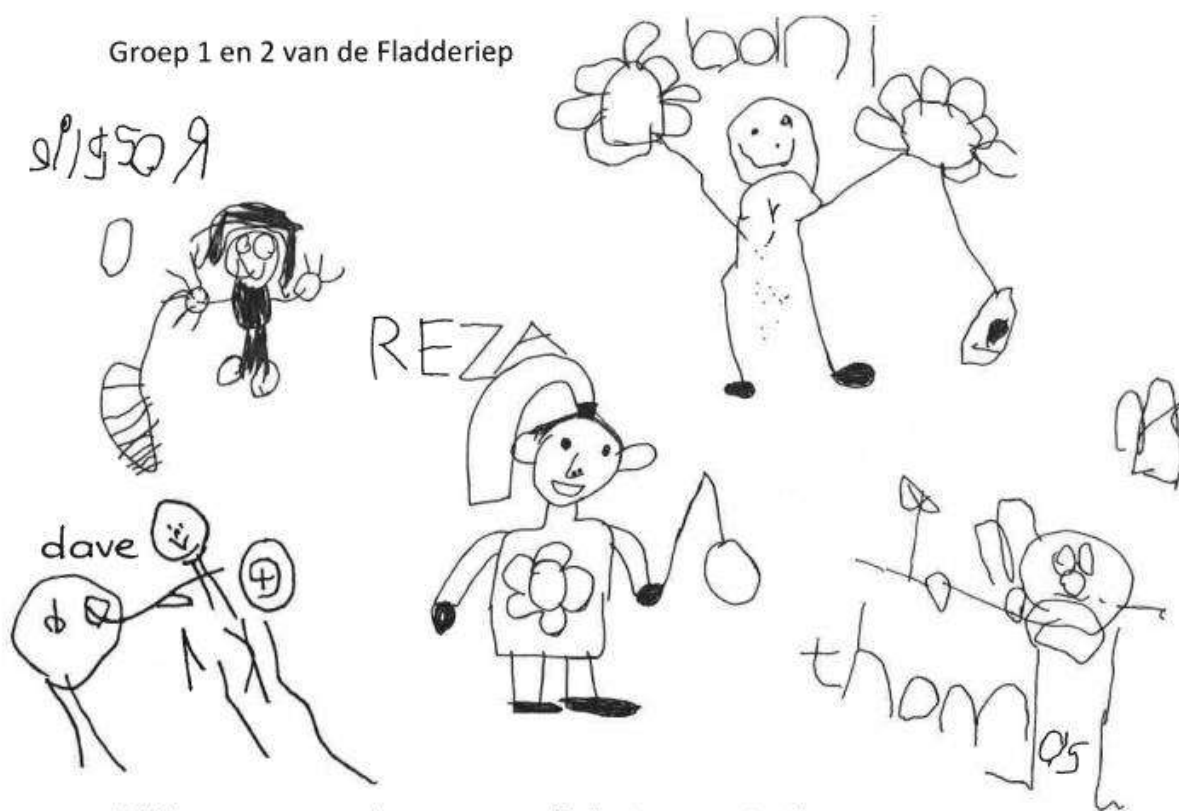
Groep 1 en 2 van de Fladderiep